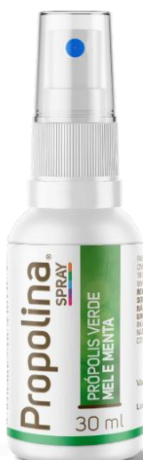
Código: 1147 Propolina SP Mel e própolis verde sabor menta Conteúdo 30 ml