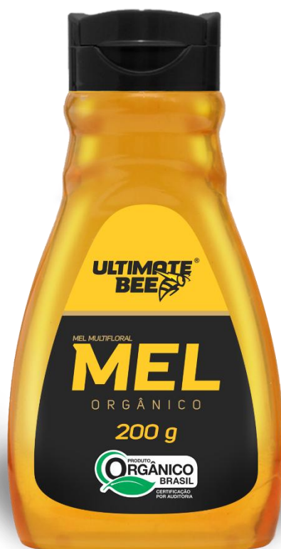
Código: 2064 Mel Ultimate Bee Orgânico Multifloral Bisnaga 200g