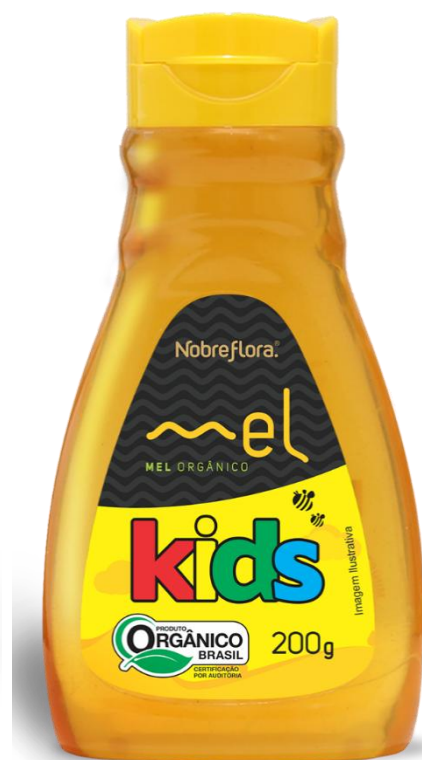
Código: 2065 Mel Kids Orgânico Multifloral Bisnaga 200g