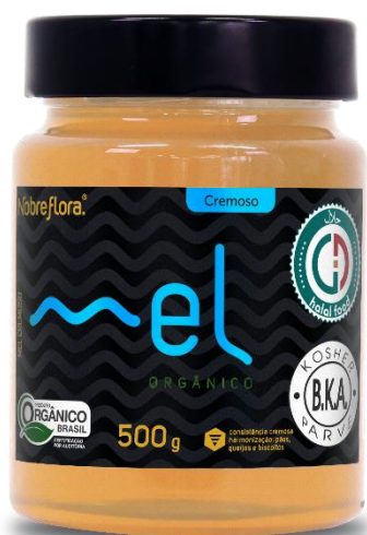
Código: 2177 Mel Orgânico Creiososo Pote 500g