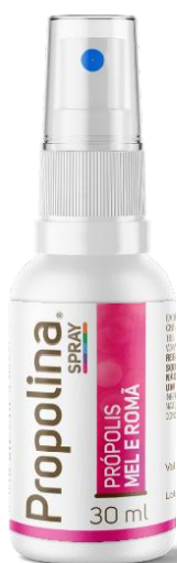
Código: 1145 Propolina SP Mel e própolis sabor romã Conteúdo 30 ml

Via oral. Aplicar o spray diretamente na boca sempre que necessário.