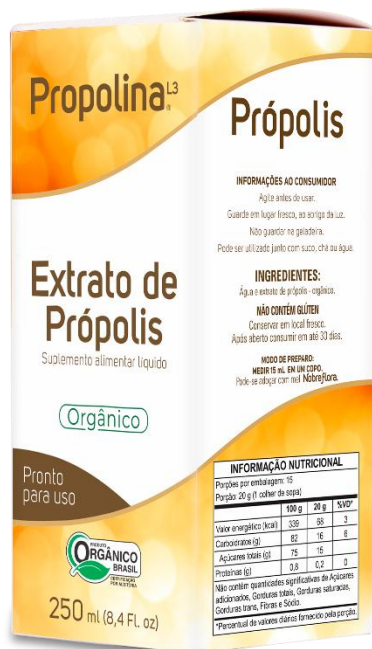
Código: 2017 Propolina L3 Orgânica Extrato de Própolis Diluído em Água

Estes produtos são orgânicos certificados.