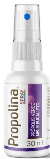
Código: 1148 Propolina SP Mel e própolis verde Sabor eucalipto Conteúdo 30 ml