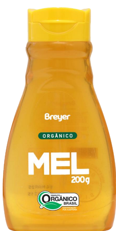
Código: 2318 Mel Breyer Orgânico Multifloral Bisnaga 200g