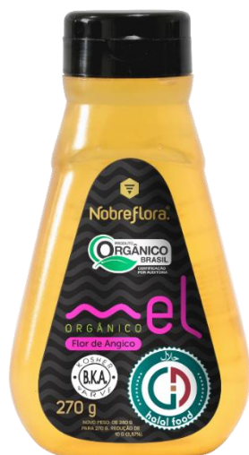
Código: 2028 Mel Orgânico Flor de Angico Bisnaga 270g