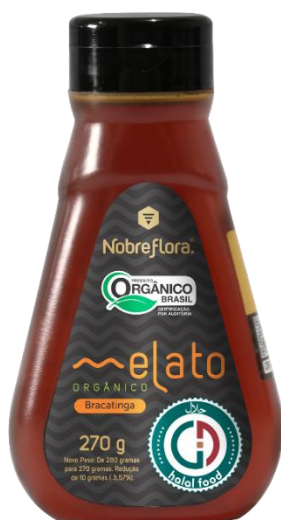
Código: 2029 Melato Orgânico Bracatinga Bisnaga 270g