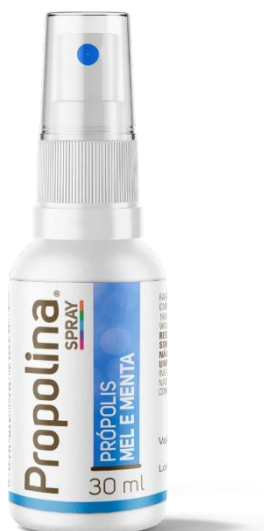
Código: 1005 Propolina SP Mel e Extrato de própolis Spray Sabor Menta Conteúdo 30 ml