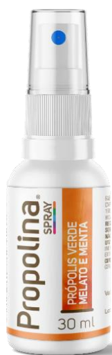
Código: 1146 Propolina SP Melato e própolis verde Sabor menta Conteúdo 30 ml