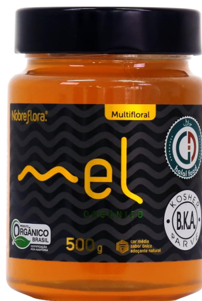
Código: 2174 Mel Orgânico Multifloral Pote 500g