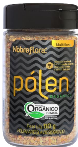
Código: 2031 Pólen Orgânico Desidratado Pote 110g

É um superalimento, considerado um dos mais ricos suplementos alimentares, sendo referido como o “ único alimento completo ”. Além das propriedades nutricionais, o pólen é um alimento com potencial bioativo, que pode auxiliar na prevenção de doenças, devido a sua importante atuação como antioxidante, anti-inflamatório e antibacteriano.