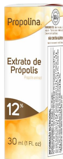
Código: 1022 Propolina 12% Extrato de Própolis 12% Conteúdo 30 ml

A Propolina L3 consiste no extrato de própolis marrom e verde diluído em água. É prático e fácil de tomar, pois já é pronto para o consumo.