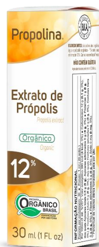
Código: 2001 Propolina 12% Orgânica Extrato de Própolis 12%