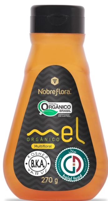
Código: 2038 Mel Orgânico Multifloral Bisnaga 270g