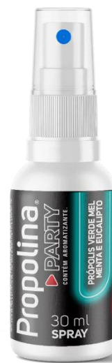
Código: 1149 Propolina SP Mel e própolis verde Sabor menta e eucalipto Conteúdo 30 ml