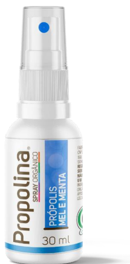
Código: 2606 Propolina SP Orgânica Mel e Extrato de própolis Spray Sabor Menta Conteúdo 30 ml

Composto que combina as propriedades bioativas do mel com o extrato de própolis adicionando a refrescância da menta, o que resulta em um produto de excelente qualidade e praticidade. Este produto é orgânico certificado.